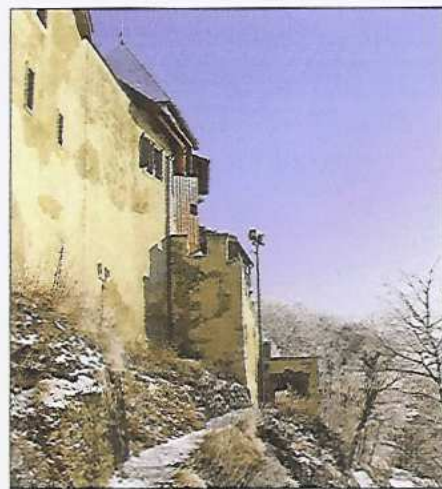
Die Burg Hohenklingen ist beliebtes Ziel für Ausflugs- und Bankettgäste.